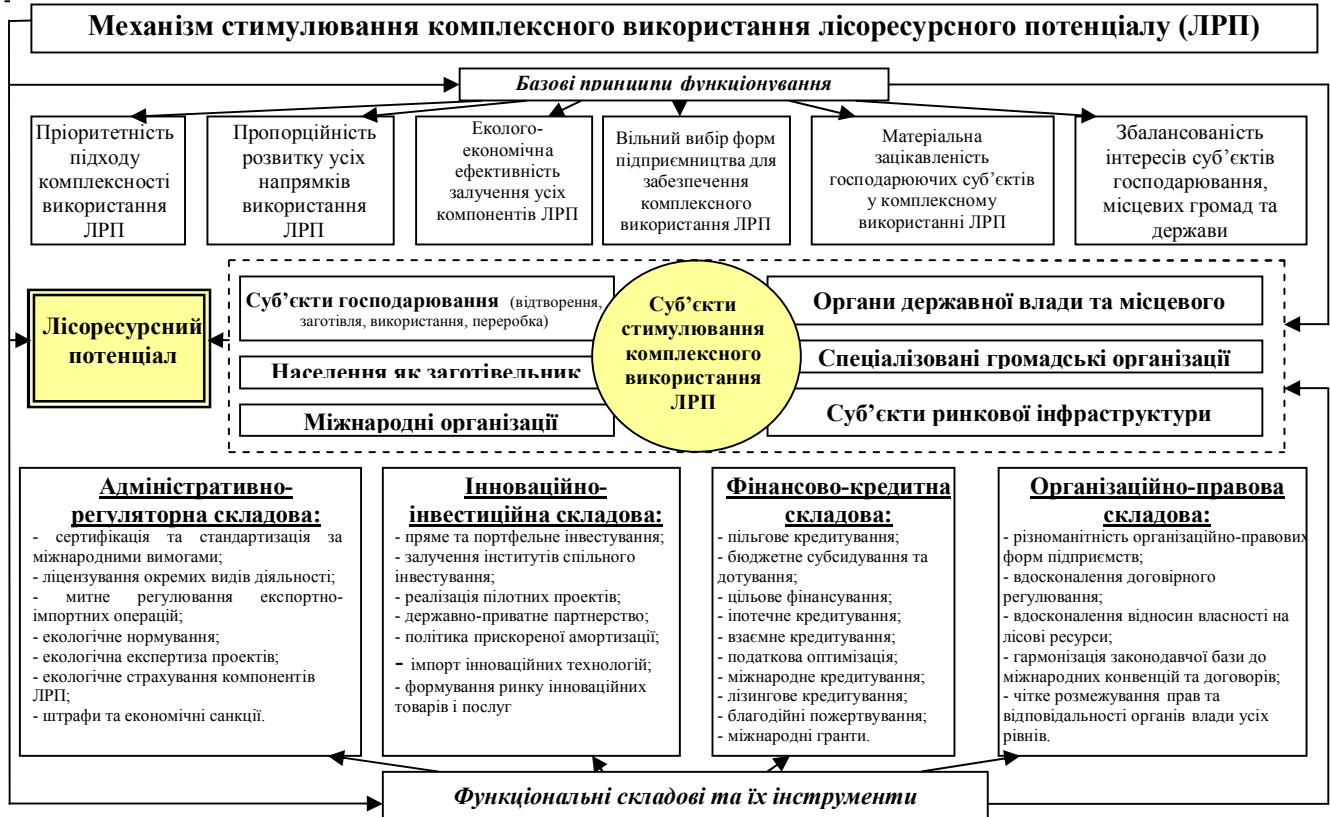
Рис.4. Організаційно-функціональна структура механізму стимулювання комплексного використання ЛРП