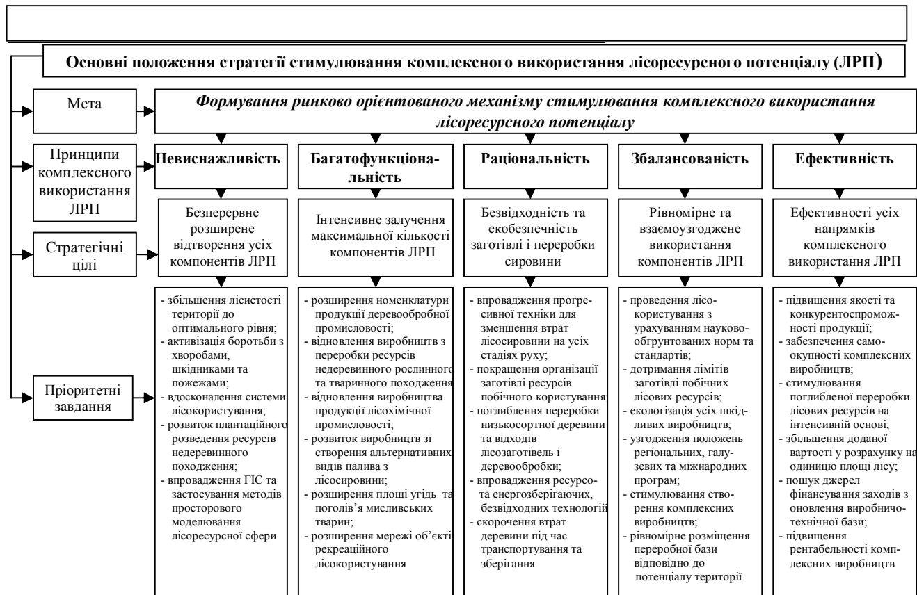
Рис. 3. Основні положення стратегії стимулювання комплексного використання лісоресурсного потенціалу