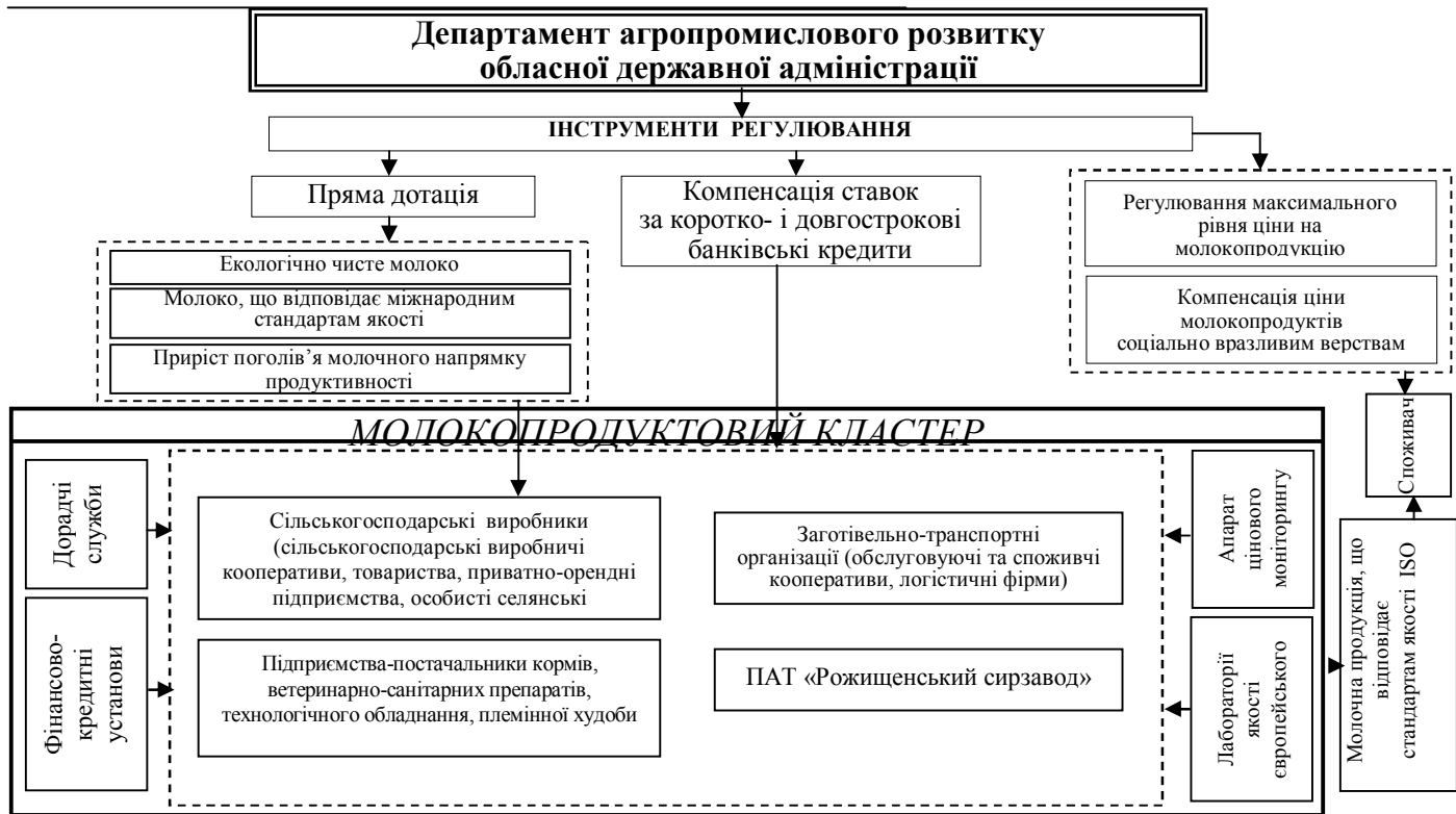
Рис. 2. Структура молокопродуктового кластеру та інструменти регулювання його розвитку