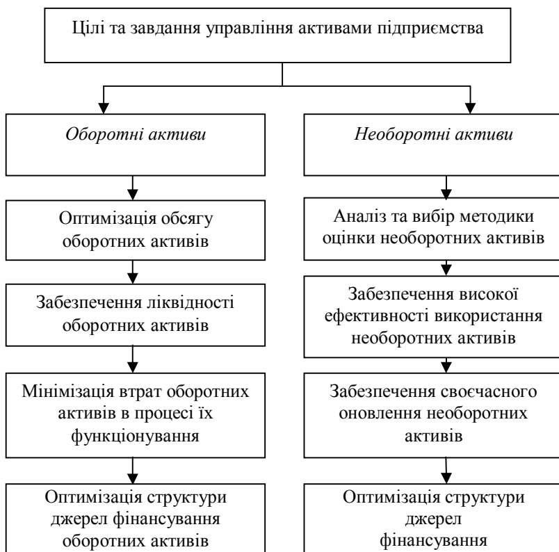
Рис. 2. Цілі управління активами підприємства