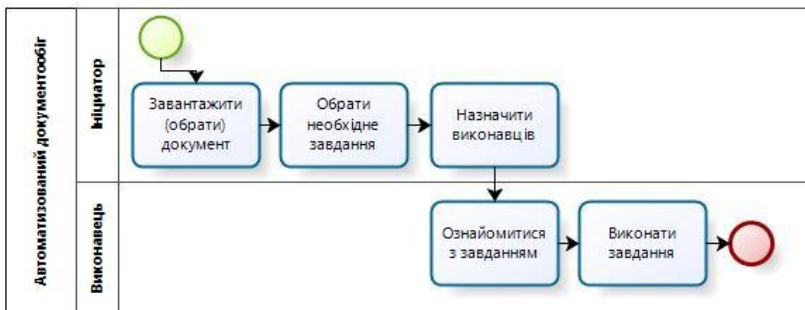
Рис. 2 Бізнес-процес автоматизованого документообігу

Система Alfresco підтримує Java-технології, у тому числі: Spring, Hibernate, Lucene, JavaServer Faces, вона є кросплатформним програмним забезпеченням (випускаються збірки для Microsoft Windows, Linux, Mac OS X). В якості СУБД для вільної редакції підтримуються MySQL і PostgreSQL [2].