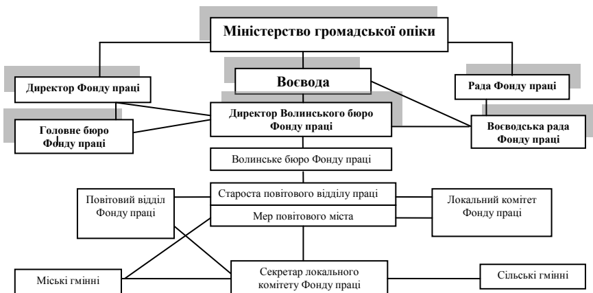
Рис. 2. Організаційна структура Фонду праці.

безробітних зайнятих роботою. На вищевказаних роботах було використано до 2600 робітників.