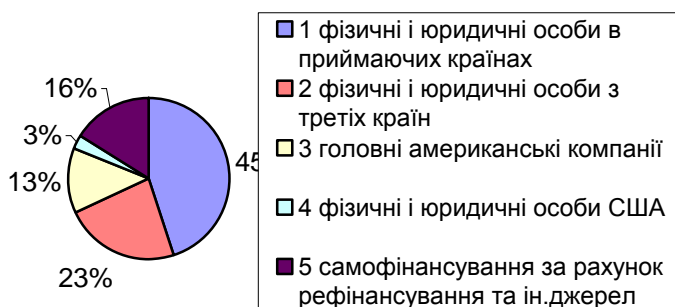
Рис 2. Джерела фінансування іноземних філіалів американських корпорацій

країн, що беруть участь (див. рис. 2). Для цього іноземні філії ТНК широко використовують позики комерційних і фінансових інститутів держави, що приймає, і третіх країн, а не тільки країн базування материнської компанії; постійна проінформованість про кон'юнктуру в товарних, валютних і фінансових ринків у різних країнах; раціональна організаційна структура, що знаходиться під пильною увагою керівництва ТНК, постійно удосконалюється; досвід міжнародного менеджменту, включаючи оптимальну організацію виробництва і збуту, підтримку високої репутації фірми.