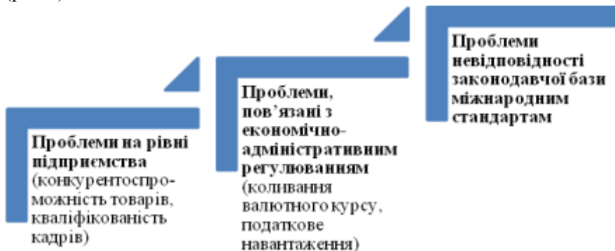
Рис. 1. Чинники гальмування вітчизняного експорту товарів і послуг

Загалом проблеми, які гальмують розвиток вітчизняного експорту товарів і послуг, можна поділити на три основні блоки (рис.1).