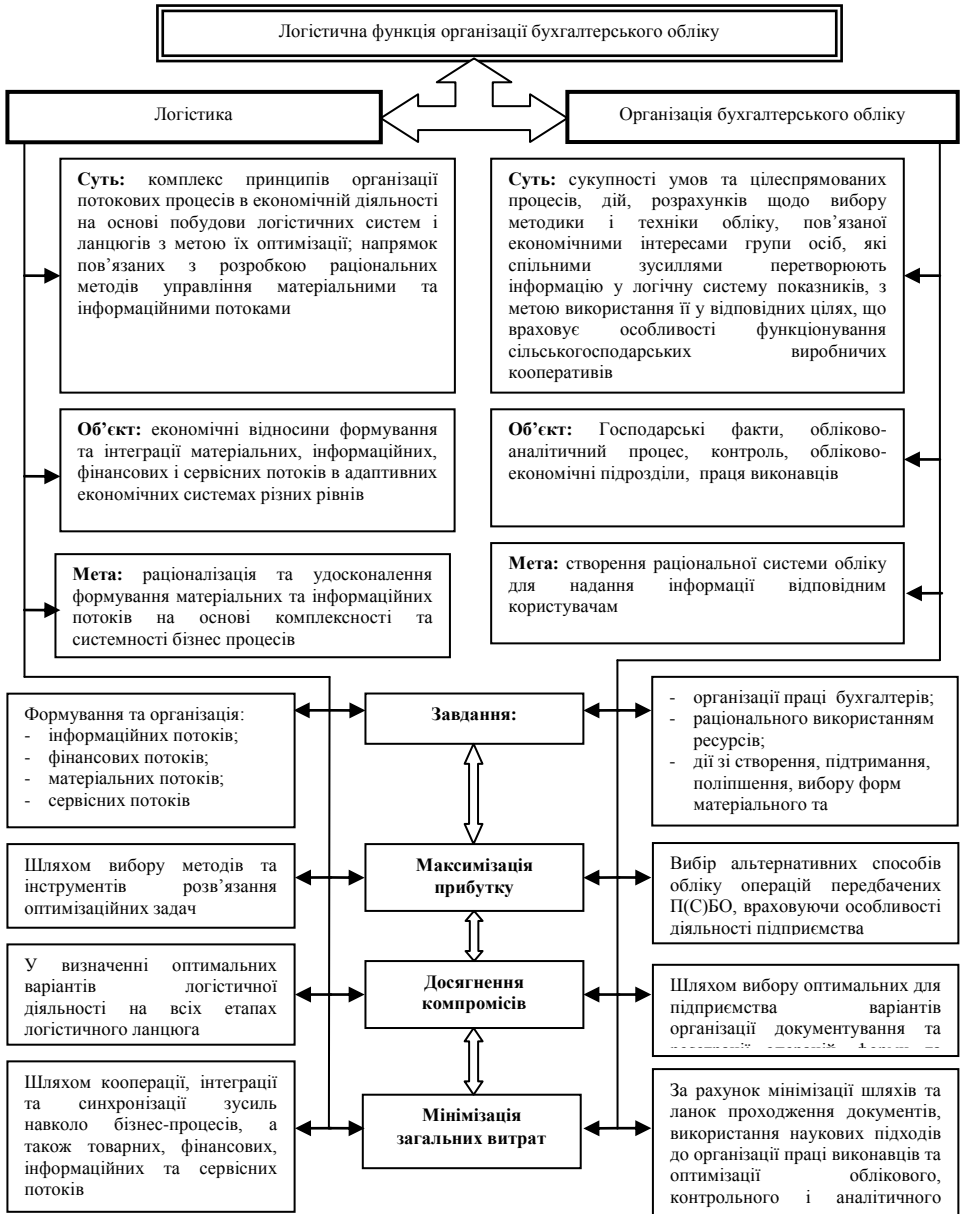
Рис. 1. Визначення логістичної функції організації бухгалтерського обліку