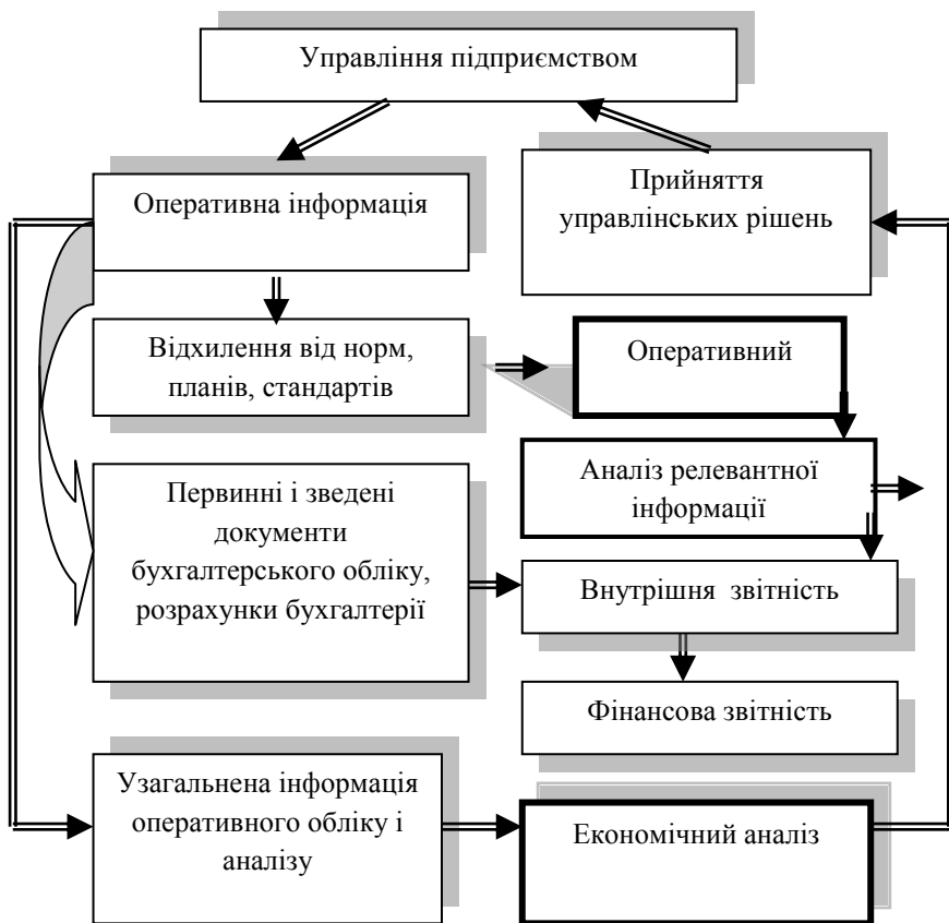
Рис. 1. Інформаційне забезпечення аналітичної роботи на підприємстві

Процес організації аналітичної роботи включає: визначення методики аналізу; вибір об'єктів, прийомів і відповідальних за виконання; збір і оцінка інформації; обробка інформації та розрахунок показників, побудова аналітичних таблиць і графіків; вибір форм звітності; формулювання висновків та пропозицій для планування, контролю відхилень і прийняття управлінських рішень. Етапи організації аналітичної роботи зображені на рис. 2.