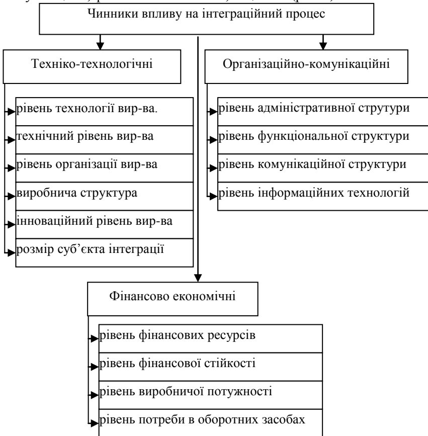
Рис. 3. Чинники впливу на інтеграційний процес

Ендогенні чинники обумовлені внутрішнім рівнем розвитку майбутніх учасників об'єднання. Запобіжне передбачення вектора дії внутрішніх чинників дозволяє визначити імовірні ризики, здатні вплинути на ефективність інтеграційного процесу та мінімізувати їх прояви ще до початку і впродовж інтеграційного процесу. Ендогенні чинники впливу на інтеграційний процес можуть бути: техніко-технологічні, організаційно-комунікаційні, фінансово-економічні, соціальні (рис. 3).