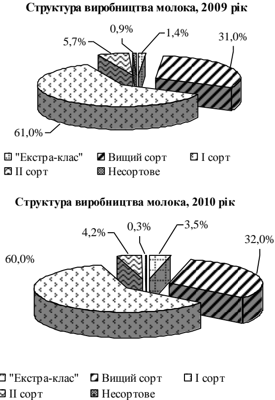
Рис. 3. Структура виробництва молока за сортністю у 2009–2010рр., %

Прийняті зміни до закону «Про молоко та молочні продукти» передбачають стимулювання в Україні виробництва високоякісного молока. Закон вводить доплату до ціни реалізації 25% виробникам молока типу «екстра» та 20% – вищого гатунку. Перший сорт якості взагалі не дотується [7]. Однак, організувати ефективну систему збору молока і контролю його якості в умовах роздрібного мілкотоварного виробництва майже неможливо. Тому зменшення кількості дрібних виробників молока та збільшення числа великих ферм, де будуть застосовуватись сучасні технології екологічного виробництва – це майбутнє молочної галузі України, що підтверджує й досвід європейських країн. Наприклад у Франції молоко для переробки закуповується від фермерських