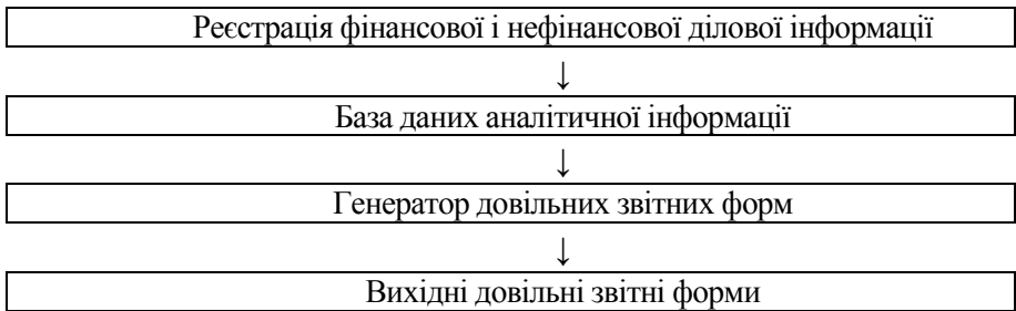
Рис. 2. Порядок створення довільних звітних форм в інформаційних системах [1, с. 116]

Під звітом традиційно розуміється спеціальним чином структуроване представлення даних, що зберігаються, і виводиться, як правило, на паперовий носій. Використовуючи переваги комп'ютерної техніки, слід врахувати, що звіти можуть також будуть представлені на екранних формах, це зумовлює виділення особливих організаційних вимог до формування звітності за допомогою програмних комп'ютерних програм: