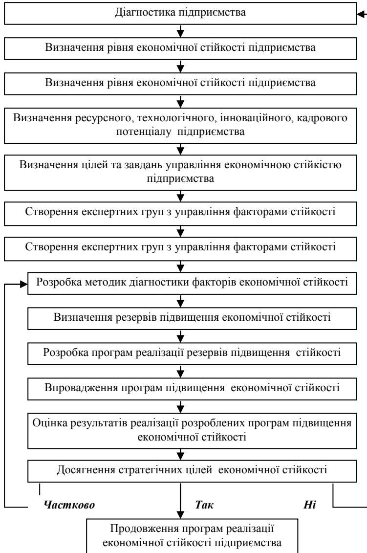
Рис. 1. Модель процесу управління економічною стійкістю підприємства