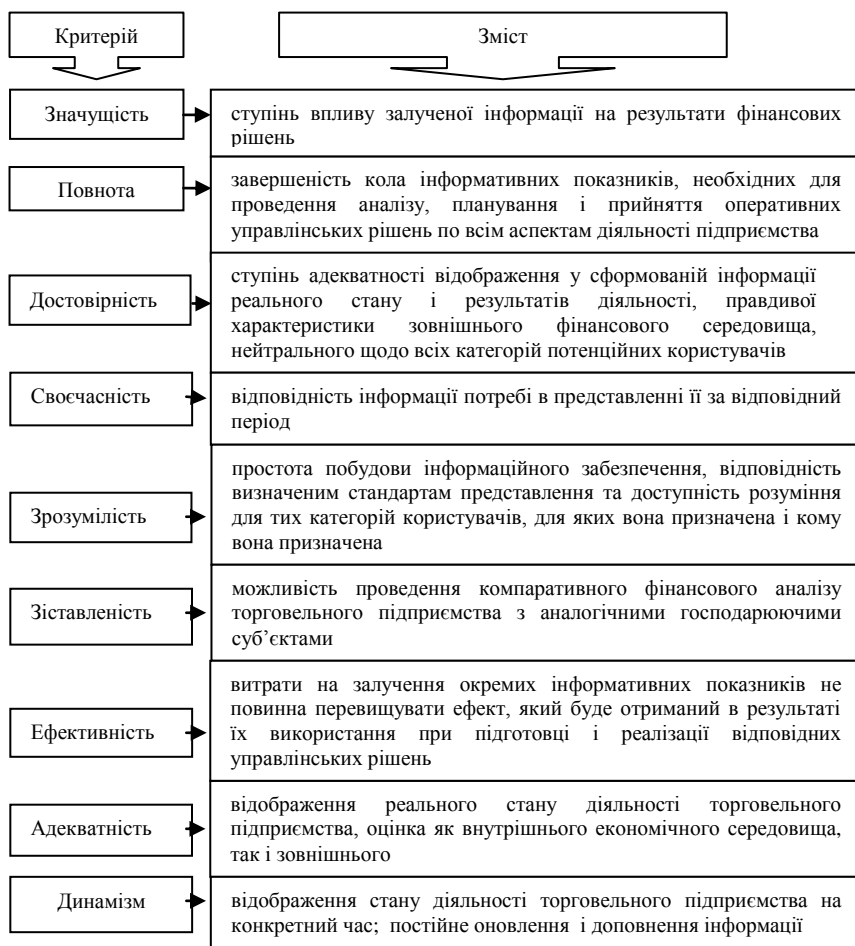
Рис. 2. Критерії якості формування інформаційного забезпечення управління діяльністю торговельних підприємств

Система інформаційного забезпечення фінансового менеджменту являє собою безперервний і цілеспрямований відбір відповідних інформаційних показників, необхідних для здійснення аналізу, планування і підготовки ефективних управлінських рішень за всіма напрямками діяльності торговельного підприємства.