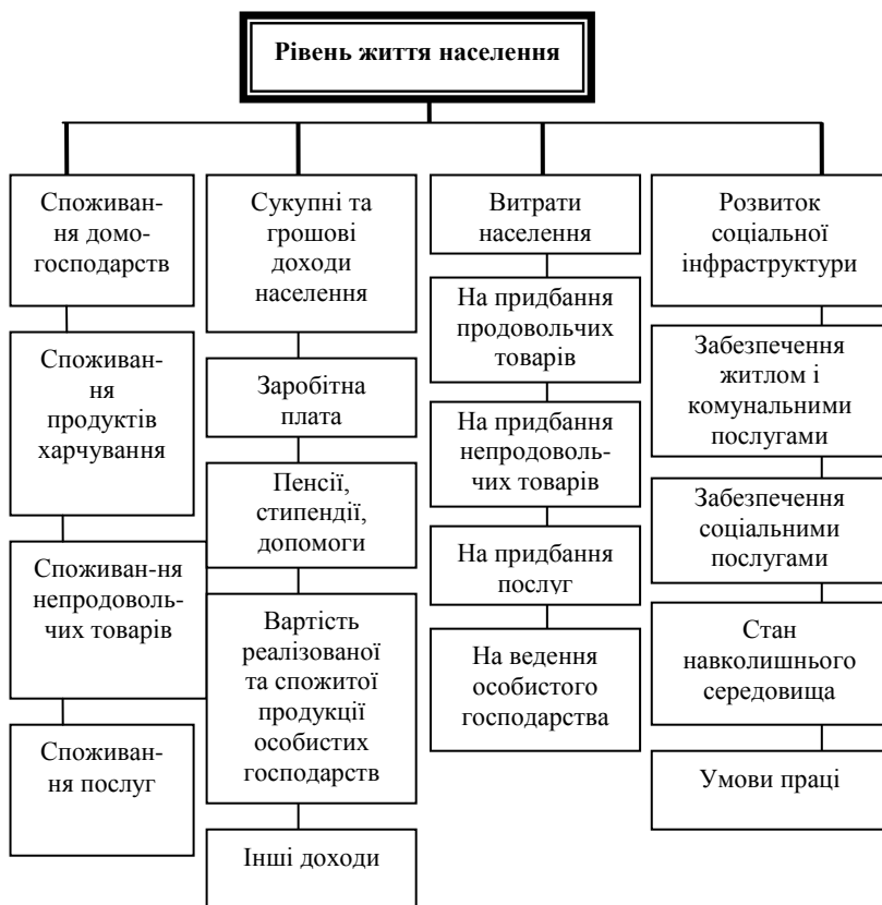
Рис 1. Складові рівня життя населення

господарствах, при одночасному зниженні частки заробітної плати, доходів від підприємницької діяльності та соціальних трансфертів, це свідчить про зниження рівня життя населення.