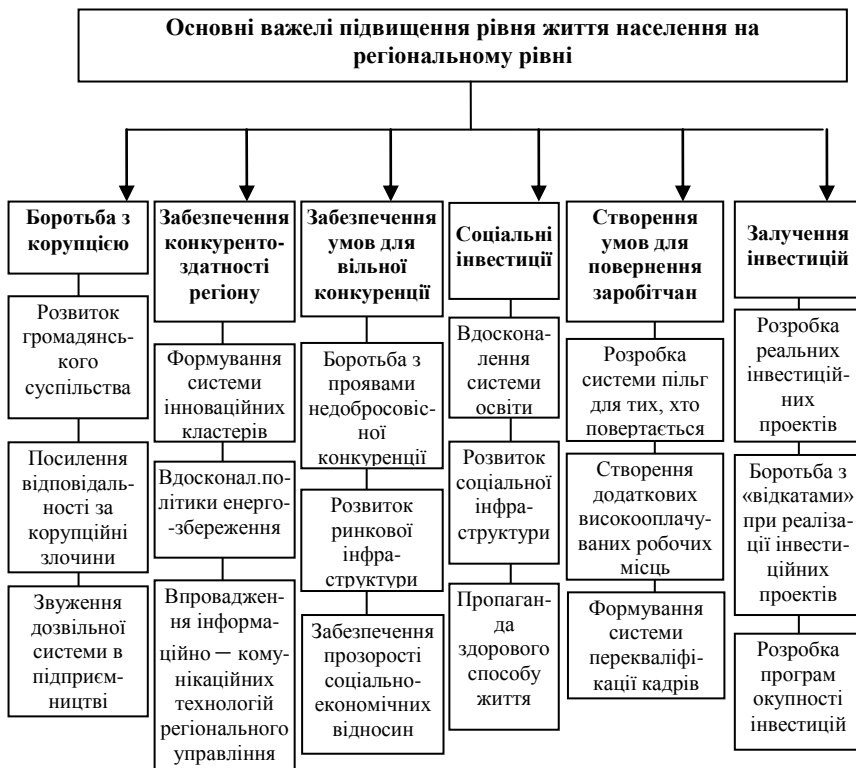
Рис 3. Основні важелі підвищення рівня життя населення на регіональному рівні

Підтримуючи точку зору вченого, відзначимо, що підвищення мінімальних соціальних стандартів не тільки відповідно до темпів зростання цін дозволяє забезпечувати необхідний рівень споживання найзлиденніших верств населення і не допускати хронічного відтворення бідності в міських та сільських домогосподарствах. Ступінь поширення бідності, склад мінімального споживчого кошика як основи для розрахунку прожиткового мінімуму повинні розглядатися гласно і широко висвітлюватися в засобах масової інформації.