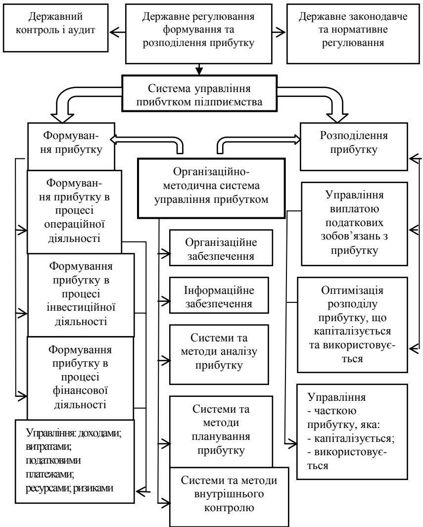
Рис. 2. Схема управління прибутком торговельних підприємств України [3]

Шостий етап – забезпечення контролю виконання управлінських рішень щодо розподілу та використання прибутку підприємства.