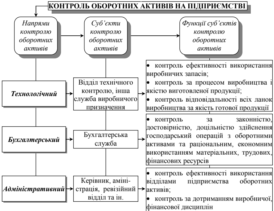
Рис. 2. Напрями контролю оборотних активів на підприємствах

цінностей, зумовленою крадіжками працівниками підприємства, виявлення застарілих та неходових матеріалів; контролю за використанням матеріалів у допоміжних цехах; контроль реалізації матеріальних цінностей на сторону та витрачання на соціально-культурні заходи.