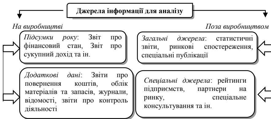
Рис. 1. Можливі джерела даних для аналізу

Інформаційно-операційне навантаження аналізу відповідно до рівня його застосування може бути різним, оскільки кожен вид аналізу має різні завдання і джерела інформації. Не існує універсального джерела. Тому необхідно проводити розмежування між закріпленими на підприємстві виробничими джерелами і міжвиробничими, які також мають свої особливі якості (рис. 1).