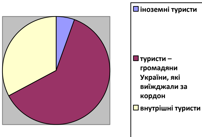
Рис. 2. Кількість туристів, обслугованих суб'єктами туристичної діяльності Волинської області за 2013 рік, %

На рис. 2. розглянемо туристичний потік у 2013 році у Волинській області.