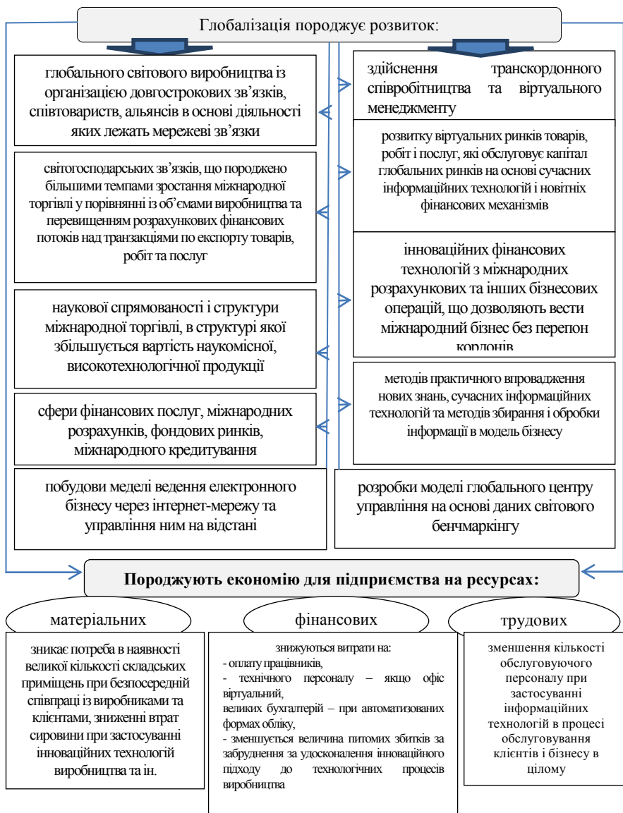
Рис. 1. Основні аспекти глобалізації