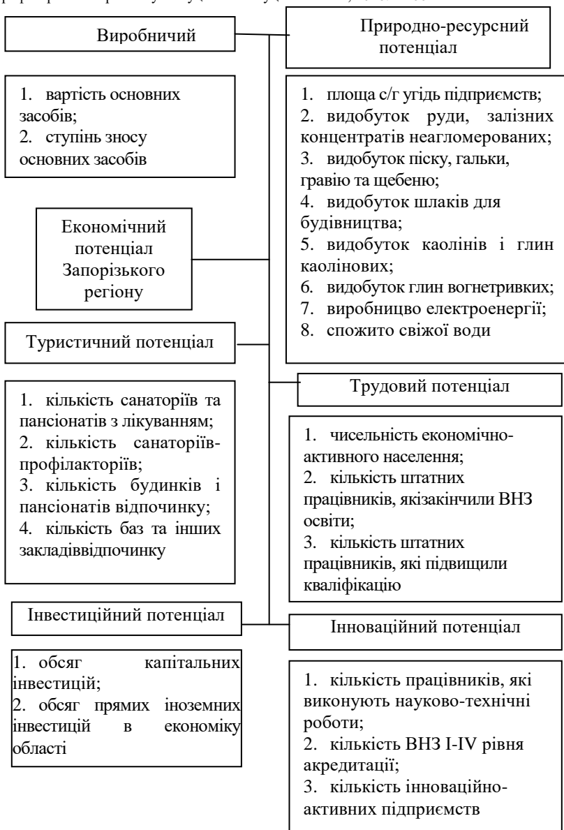
Рис.1. Структура і показники економічного потенціалу області