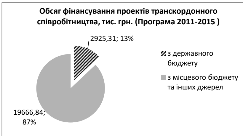
Рис. 1. – Структура фінансування проектів транскордонного співробітництва в Програмі 2011 – 2015.