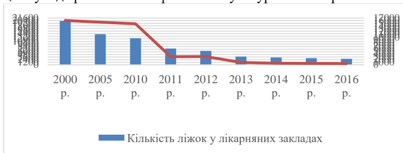
Рис. 3. Стан медичної інфраструктури в сільській місцевості

дотримуватися культури самозбереження. Велике значення в цьому відіграє й заняття фізичною культурою та спортом.