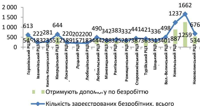
Рис. 2. Порівняльний аналіз кількості зареєстрованих безробітних та тих, хто отримував допомогу по безробіттю за територіальними центрами зайнятості Волинської області у 2016 році (побудовано за даними [10; 11])

Подальшу оцінку безробіття в регіоні проведемо на основі порівняння кількості безробітного населення та чисельності безробітних, що отримували допомогу (рис. 2).