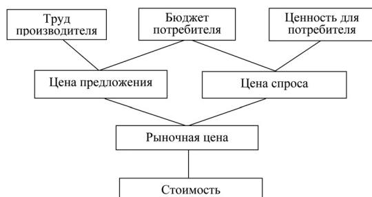
Рис. 4. Формирование цены и стоимости