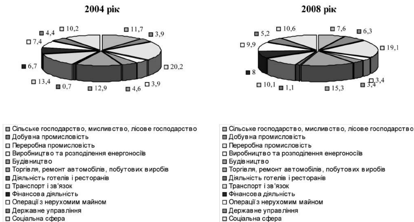
Рис.1. Структура валової доданої вартості за видами економічної діяльності