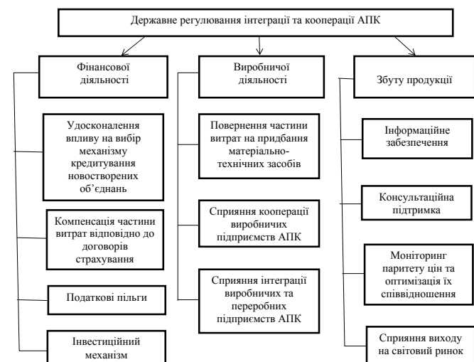
Рисунок. Організаційно-економічні заходи державного регулювання та підтримки АПК*

Для фінансування поточного капіталу експерти RIAS пропонують створити в Україні фонд гарантування кредитів [7]. У країнах Західної Європи такі фонди працюють вже тривалий час і накопичили чимало досвіду, який міг би стати корисним і для нашої країни. Всі ці заходи мають активізувати процес створення кооперативних