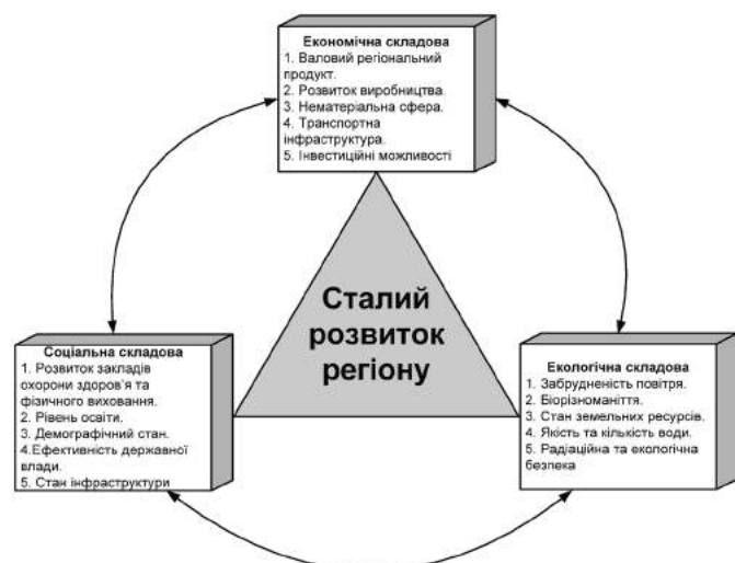
Рис. 1. Складові сталого розвитку регіону

Соціальна складова орієнтована на людський розвиток, на збереження стабільності суспільних і культурних систем, на зменшення кількості конфліктів у