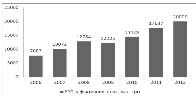
Рис. 1. Динаміка валового регіонального продукту у 2006-2012 роках у Волинській області

Що стосується капітальних інвестицій у 2012 році, то стабільно основним джерелом їх фінансування є власні кошти підприємств – 46,9% та кошти населення на індивідуальне житлове будівництво – 23,3%. Регіон можна назвати депресивним щодо залучення інвестицій, адже кошти іноземних інвесторів у структурі капітальних інвестицій становлять лише 0,3%. А розмір прямих іноземних інвестицій у 2012 році сягав лише 361,2 млн. дол. США, що дорівнює 0,7% від загального обсягу прямих іноземних інвестицій в економіку України (див. табл.) [4].