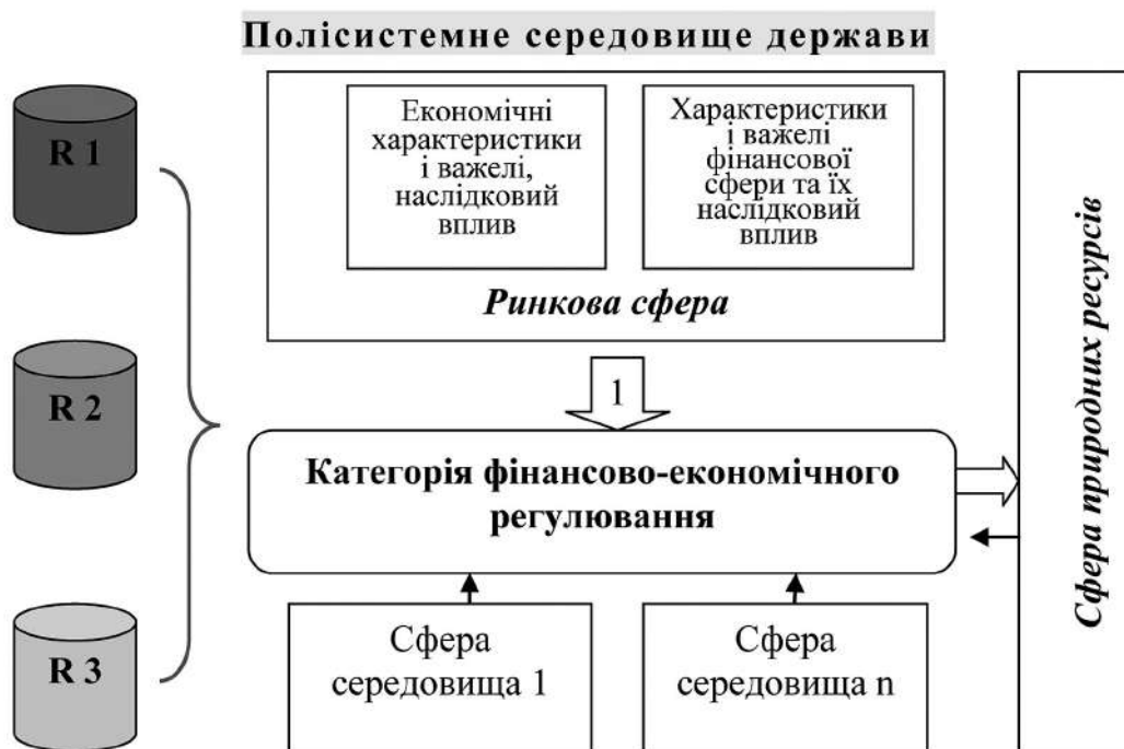
Рис. 1. Вплив окремих факторів на формування характеристик категорії фінансово-економічного регулювання (R1-R3 – рівні організації простору (глобальний, національний, субнаціональний); стрілка 1 – переважаючий вплив, решта – допоміжний)

Як свідчить рис. 1 , дія економічних характеристик і важелів, що їх обумовлюють, а також вплив фінансових локалізована у межах різних блоків ринкової сфери. Крім того, до впливу цих блоків долучають-