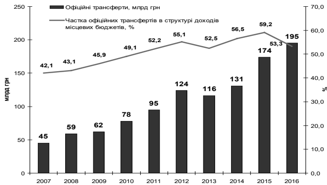
Рис. 1. Офіційні трансферти місцевим бюджетам та їх частка в структурі доходів місцевих бюджетів (розраховано за даними Державної казначейської служби України)

Збільшення доходів до місцевих бюджетів України має номінальний характер, свідченням чого є динаміка доходів місцевих бюджетів у порівняних цінах 2007 року. Позитивних зрушень у динаміці реальної величини надходжень до місцевих бюджетів в останні роки не спостерігалось. На тлі висхідного тренду в номінальних доходах місцевих бюджетів має місце синусоїдна тенденція в динаміці доходів у порівняних цінах 2007 року. Якщо у 2007 доходи місцевих бюджетів становили 107 млрд грн, у 2010 – 95 млрд грн, у 2013 – 114 млрд грн, то у 2016 – 88 млрд грн (рис. 2).