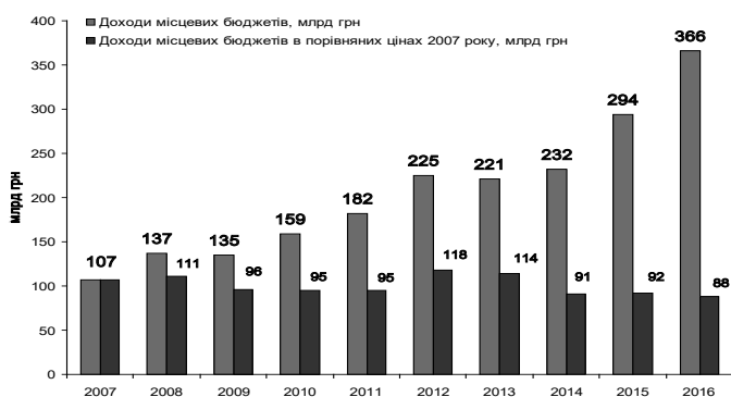
Рис. 2. Номінальні доходи та доходи у порівняних цінах 2007 року місцевих бюджетів (з урахуванням трансфертів) (розраховано за даними Державної казначейської служби України)

Однією з основних складових доходів місцевих бюджетів є податкові надходження. За період 2007-2016 років у динаміці податкових надходжень до місцевих бюджетів у цілому спостерігалась висхідна тенденція, що зумовлено переважно інфляційно-девальваційними коливаннями та перерозподілом