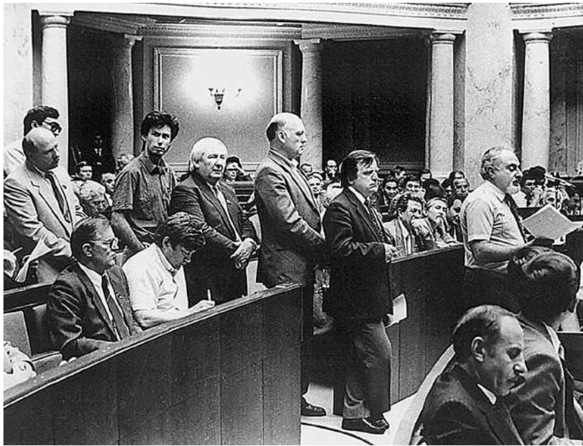
На знімку: у Верховній Раді України під час прийняття Декларації про державний суверенітет України.

ціального розвитку України (регіональний розріз).