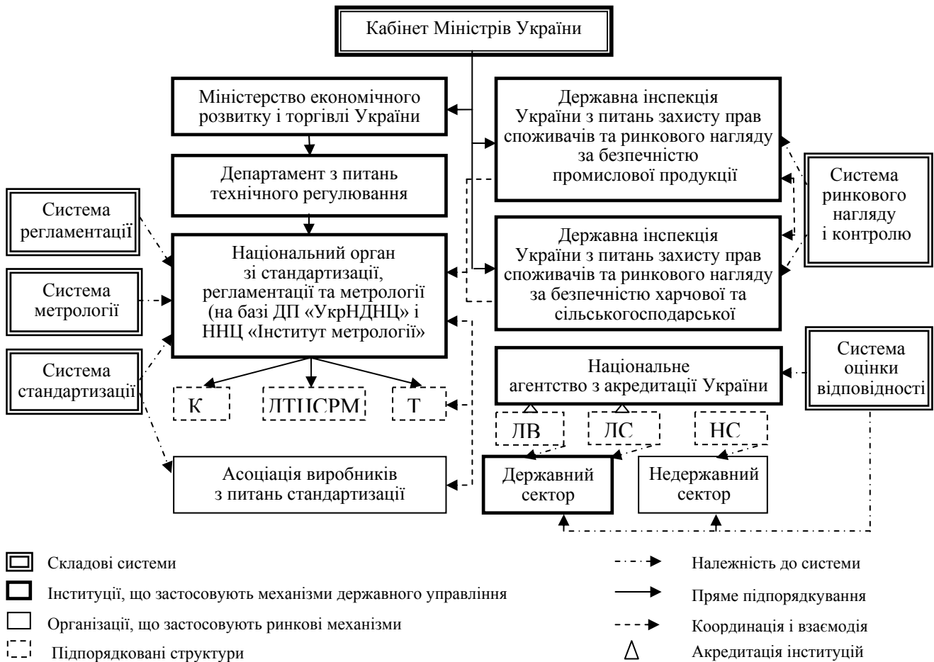
Рис. 3. Інституціональна структура та складові трансформованої системи організаційно-технічного регулювання національної економіки:

Розроблено організаційну структуру системи організаційно-технічного регулювання з визначенням національних органів за всіма її складовими системами (рис. 3).