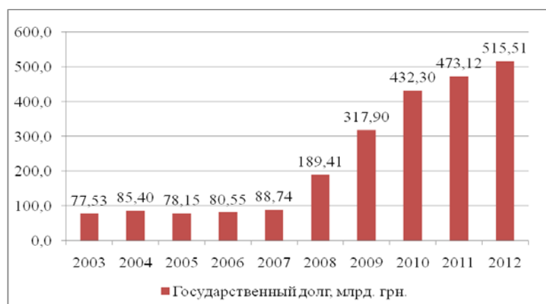
Рис. 2. Динамика государственного долга в Украине в 2003-2012 гг., млрд. грн.

Источник: составлено автором на основе данных Министерства финансов Украины