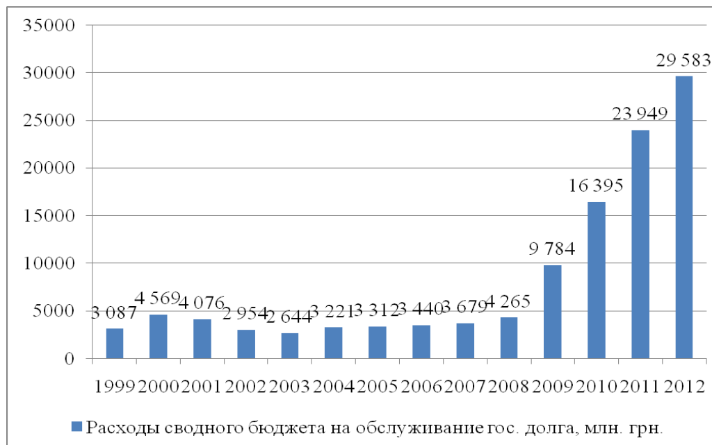
Рис. 3. Расходы сводного бюджета на обслуживание государственного долга (млн. грн.)

возникли значительные проблемы с финансированием дефицита бюджета и Пенсионного фонда Украины.