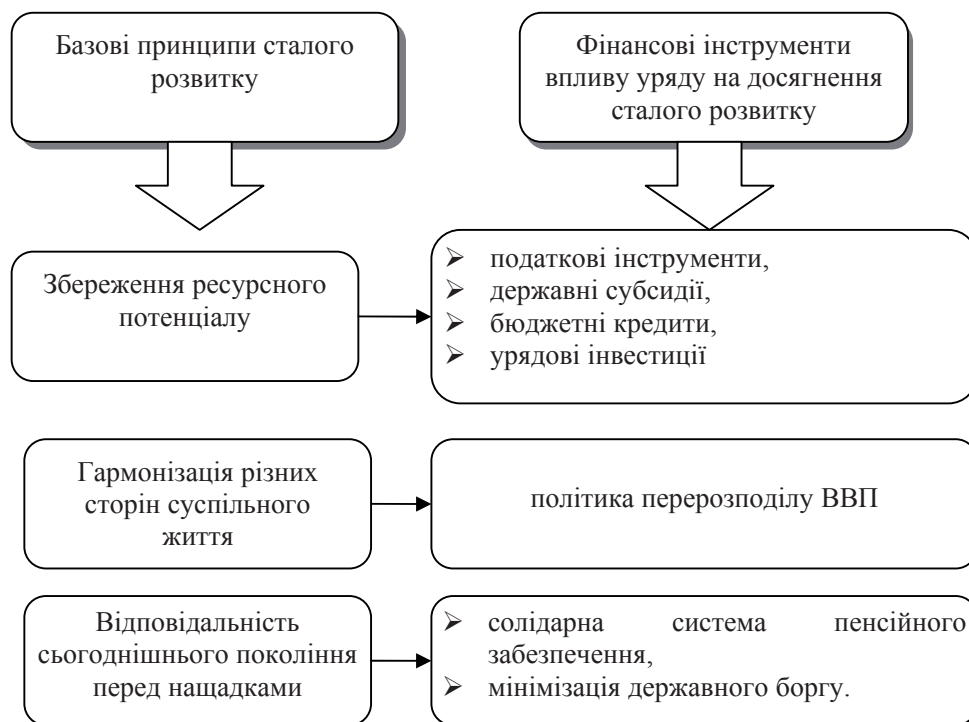
Рис 2. Фінансові інструменти, за допомогою яких уряд сприяє втіленню в життя базових принципів сталого розвитку

3. Врахування інтересів майбутніх поколінь. Цей принцип – гармонізація у часі міжпоколінних відносин – є продовженням і деталізацією другого принципу. При цьому на перше місце ставиться не сам по собі розвиток, а нащадки, які не повинні бути позбавлені через безвідповідальність нинішнього покоління економічних і соціальних можливостей, а також природного безпечного довкілля.