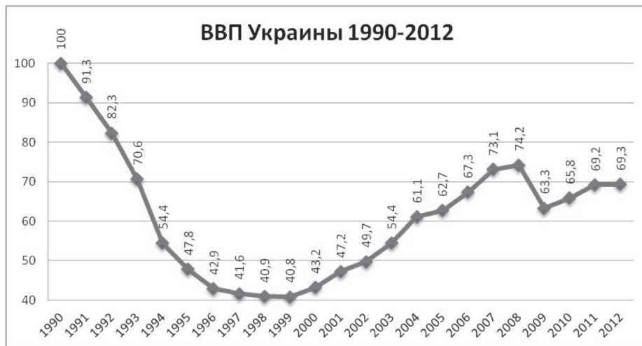
Валовый внутренний продукт Украины за 1990-2012 гг.