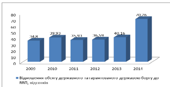
Рис. 1. Відношення обсягу державного та гарантованого державою боргу до ВВП, відсотків

Аналіз другого показника – відношення обсягу валового зовнішнього боргу до ВВП свідчить про практично стале значення показника, але все ж таки критичне, що пов’язано зі зменшенням обсягу валового зовнішнього боргу, але незначне.