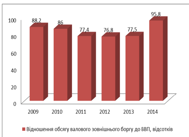
Рис. 2. Відношення обсягу валового зовнішнього боргу до ВВП, відсотків

Аналіз другого показника – відношення обсягу валового зовнішнього боргу до ВВП свідчить про практично стале значення показника, але все ж таки критичне, що пов’язано зі зменшенням обсягу валового зовнішнього боргу, але незначне.