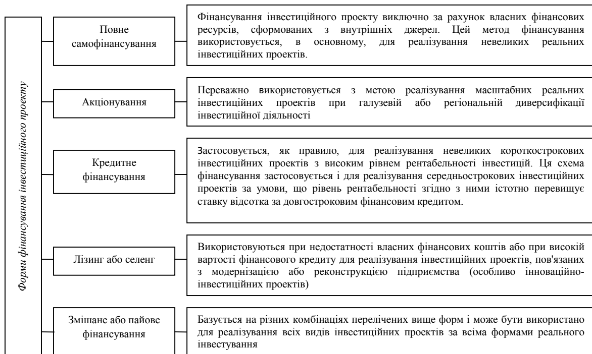
Рис. 5. Основні форми фінансування інвестиційного проекту (розроблено на основі [10])

У своїх дослідженнях І.П. Мойсеєнко розглядає п'ять основних варіантів поєднання ресурсів з метою фінансування інвестиційного портфелю підприємства (рис. 5) [10].