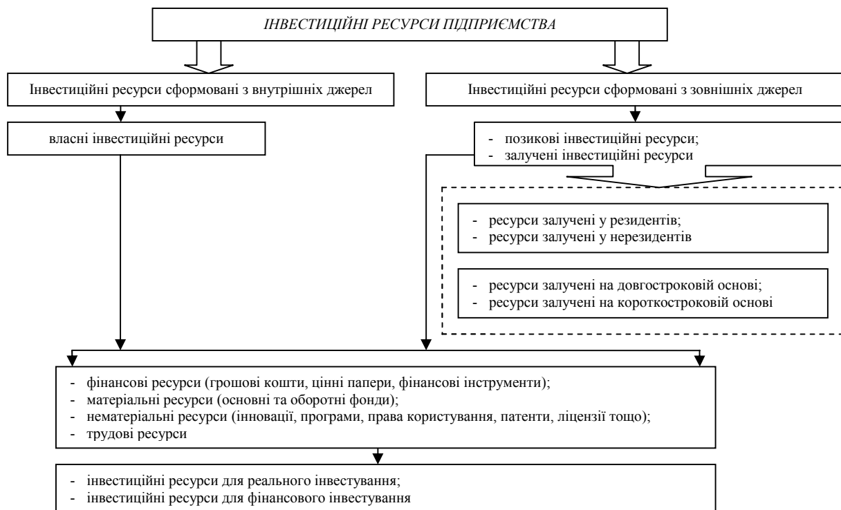
Рис. 1. Класифікація інвестиційних ресурсів підприємства (розроблено на основі [2, 3, 5])

Отже, інвестиційна діяльність підприємства здійснюється за рахунок інвестиційних ресурсів. Інвестиційні ресурси – це активи, які підприємство використовує для забезпечення інвестиційної діяльності. Розглянемо класифікацію інвестиційних ресурсів (рис. 1).