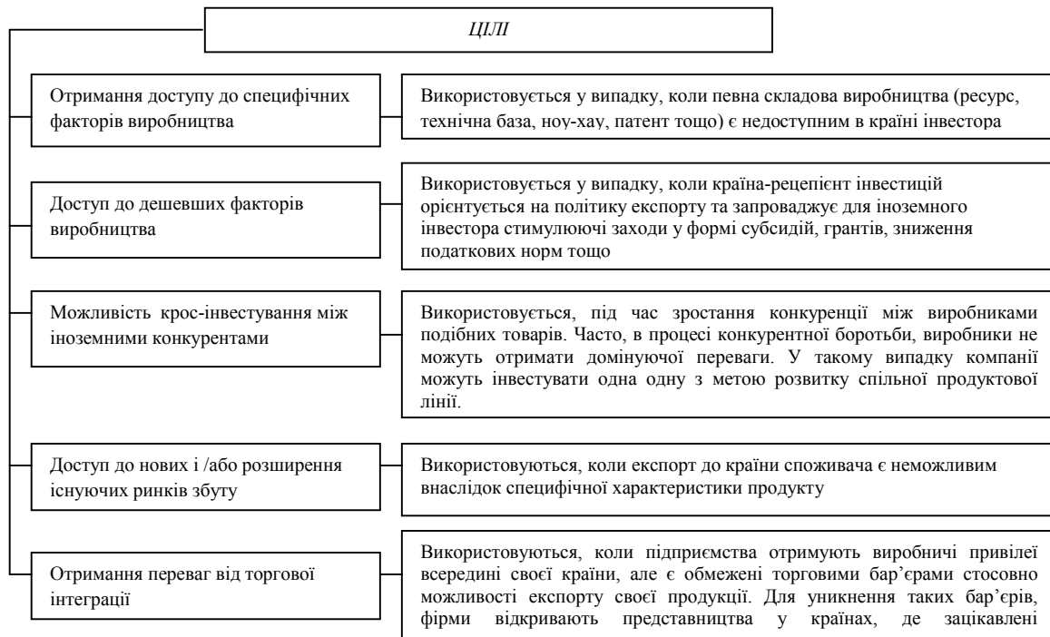
Рис. 3. Цілі здійснення прямих іноземних інвестицій (розроблено на основі [7])

інших фінансових активів або вкладення коштів у підприємства без права контролю над їх діяльністю.