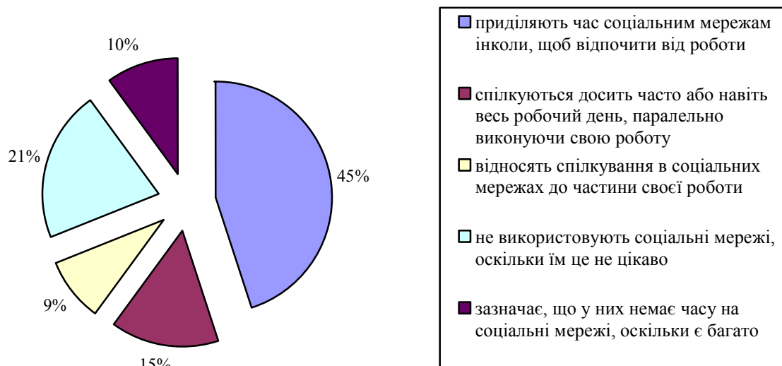
Рис. 1. Користування соціальними мережами в робочий час офісними працівниками [9]

портал» серед зареєстрованих користувачів. За результатами даного дослідження (рис. 1): 45% респондентів приділяють час соціальним мережам інколи, щоб відпочити від роботи; 15% – спілкуються досить часто або навіть весь робочий день, паралельно виконуючи свою роботу; 9% – відносять спілкування в соціальних мережах до частини своєї роботи; 21% – не використовують соціальні мережі, оскільки їм це не цікаво; 10% – зазначає, що у них немає часу на соціальні мережі, оскільки є багато роботи [9].