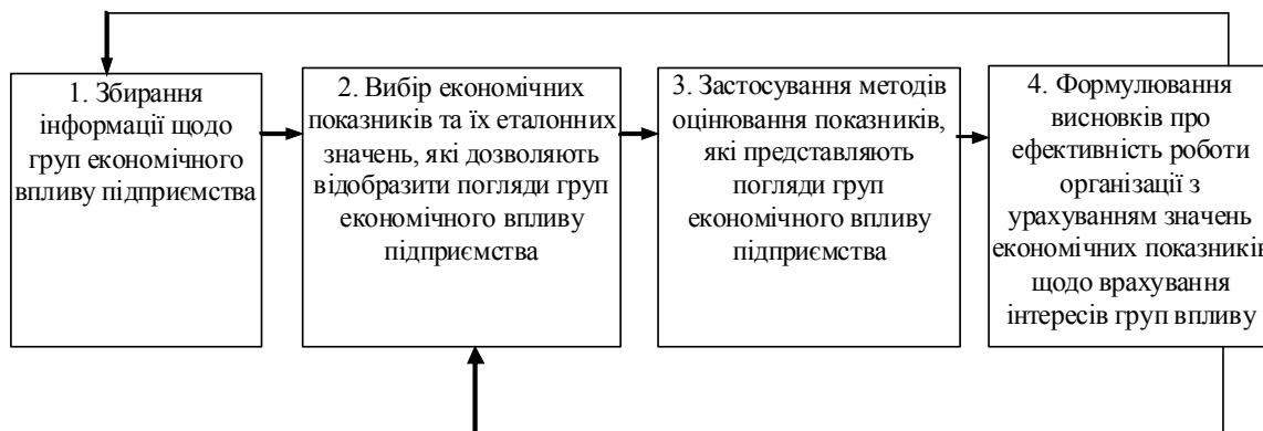
Рис. 2. Процес оцінювання економічних показників діяльності підприємства при врахуванні поглядів груп економічного впливу (розроблено на основі аналізування [8-10])

Послідовність оцінювання економічних показників діяльності підприємства при врахуванні поглядів груп економічного впливу, наведена на рис. 2.