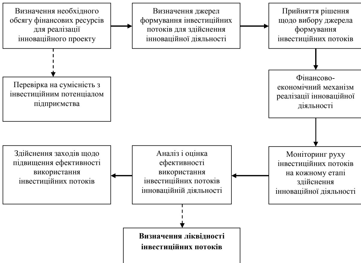
Рис. 2. Організаційно-функціональний механізм управління інвестиційними потоками аграрних підприємств