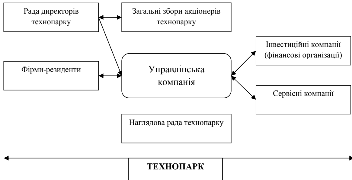
Рис. 2. Організаційна структура технопарку

Організаційна структура технопарку включає управлінську компанію, якірні, інноваційні та інвестиційні компанії (рис. 2). Діяльність управлінської компанії регулюється Радою директорів, що обирається загальними зборами акціонерів, і курується Наглядовою радою технопарку. На чолі управлінської компанії знаходиться директор, який призначається Радою директорів і підзвітний Наглядовій раді. Побудова гнучкої організаційної структури управлінської компанії є одним із завдань менеджменту технопарку.