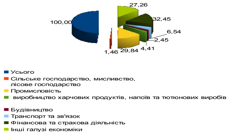
Рис. 1. Структура надходжень прямих іноземних інвестиційних потоків, на 31.12.12, %

потоків. Саме тому в національну економіку залучаються кредити як окремих держав і приватних фірм, так і Світового банку та Міжнародних фінансових організацій, де в структурі надходжень прямих іноземних інвестиційних потоків харчова промисловість посідає помітне місце (рис. 1, табл. 2).