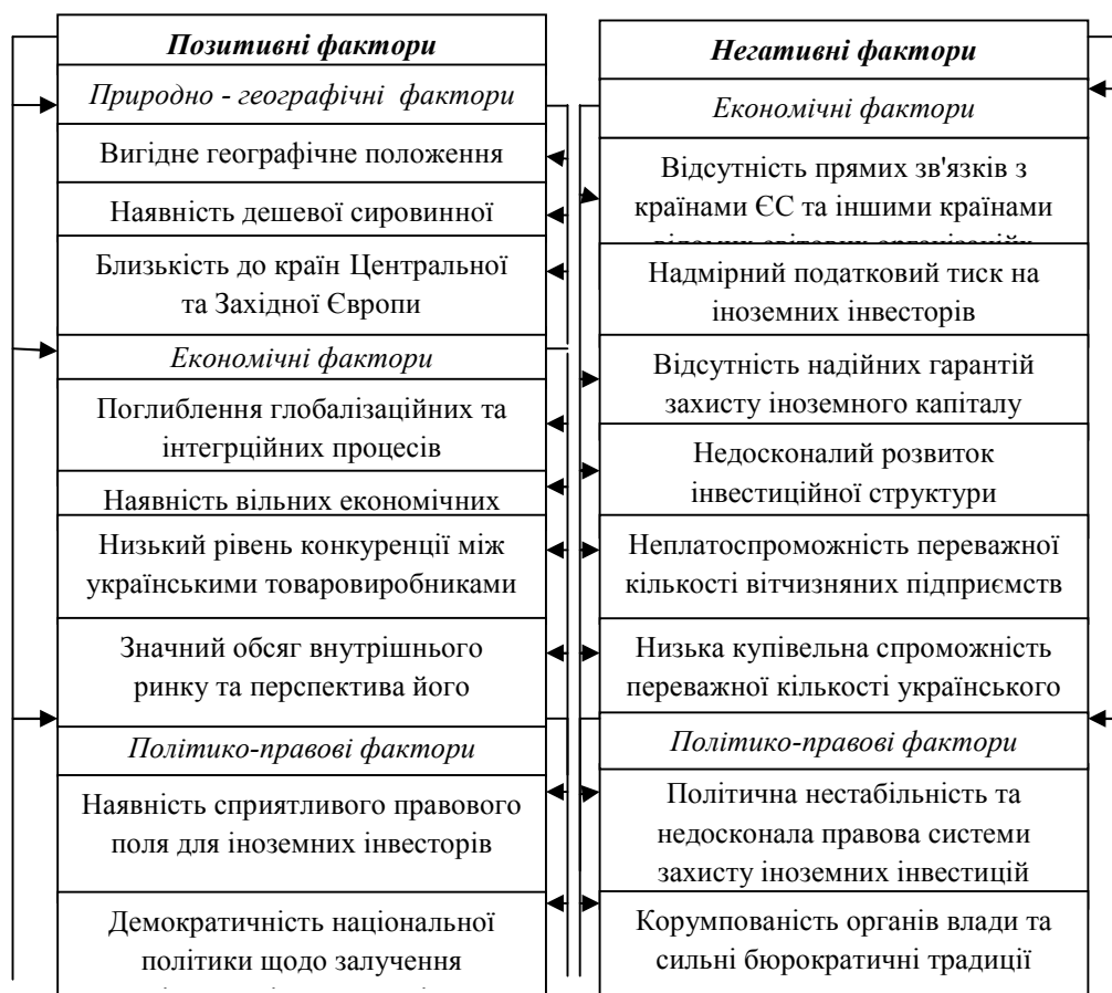
Рисунок 4. Фактори впливу на рух іноземних інвестиційних потоків в харчову промисловість України

функціонування масштабних інвестиційних потоків. Обережність та нерішучість потенційних інвесторів у прийнятті фінальних рішень в подібній обставині – закономірний факт. Для заохочення та зміцнення руху іноземних інвестиційних потоків в пріоритетні галузі економіки держави, зокрема в харчову промисловість, скерований Закон України «Про державну програму заохочення іноземних інвестицій в Україні», що передбачає надання різного роду страхових гарантій, особливо по найбільш важливим інвестиційним програмам і проектам, розвитку інфраструктури міжнародного бізнесу, покращення правового регулювання іноземного інвестування [9].