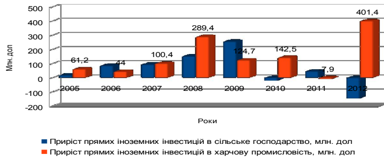
Рисунок 2. Приріст прямих іноземних інвестиційних потоків в сільське господарство та харчову промисловість, млн. дол. США