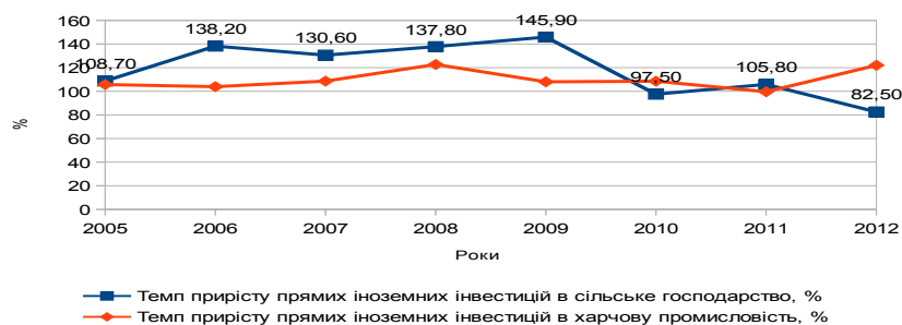
Рисунок 3. Темп приросту прямих іноземних інвестиційних потоків у сільське господарство та харчову промисловість, млн. дол. США

В цілому в 2012 році частка прямих іноземних інвестиційних потоків в харчовій промисловості України помітно зростає і становить 20% від суми активів харчової промисловості України.