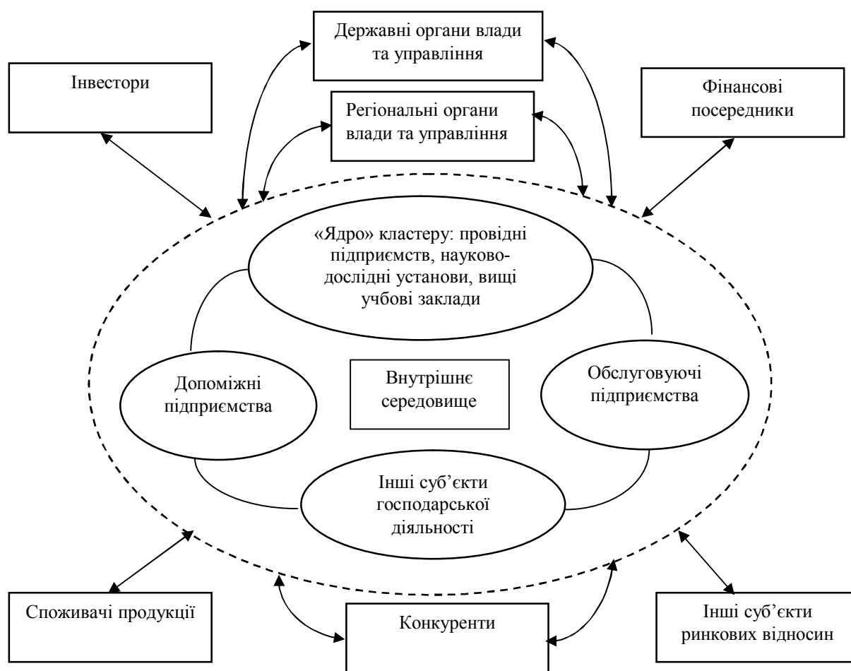
Рис. 2. Модель інноваційного науково-виробничого кластеру

конкурентних переваг тільки за допомогою інновацій, якщо освоюють нові методи досягнення конкурентоспроможності або знаходять кращі способи конкурентної боротьби, використовуючи старі способи. У ринковій економіці інновації являють собою сильну зброю конкуренції, оскільки ведуть до зниження собівартості і, отже, до зниження цін, зростання прибутку, підвищенню іміджу виробника нових продуктів, відкриття та захоплення нових ринків, у тому числі нових. Підвищення ефективності роботи інноваційних підприємств в Україні стимулюється за рахунок загострення конкуренції як на внутрішньому, так і на зовнішньому ринках.