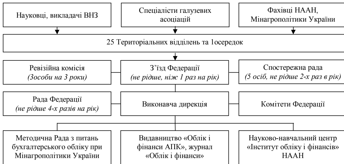
Рис. 2. Організаційна структура функціонування ФАБФ АПКУ

нізації та можливості ФАБФ АПКУ в допомозі кар'єрному росту. Проте, згодом через плінність кадрів на кафедрах ця робота була практично зведена до нуля. Інформаційні стенди залишились лише в окремих територіальних відділеннях (Житомирське, Запорізьке) і робота по їх розміщенню, безперечно, потребує поновлення у всіх відділеннях.