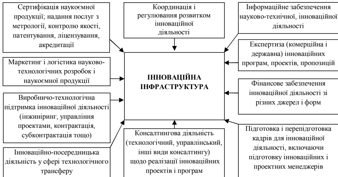
Рис. 1. Підсистеми інноваційної інфраструктури в НІС країни

послуги з перепідготовки фахівців, пошуку і надання інформації за певною технологією, юридичні консультації. Як вже зазначалося, до складу технопарку в якості його окремого структурного елементу може входити бізнес-інкубатор. У ролі засновників технопарків найчастіше виступають університети, технічні та інші вузи, науково-дослідні та конструкторські установи.