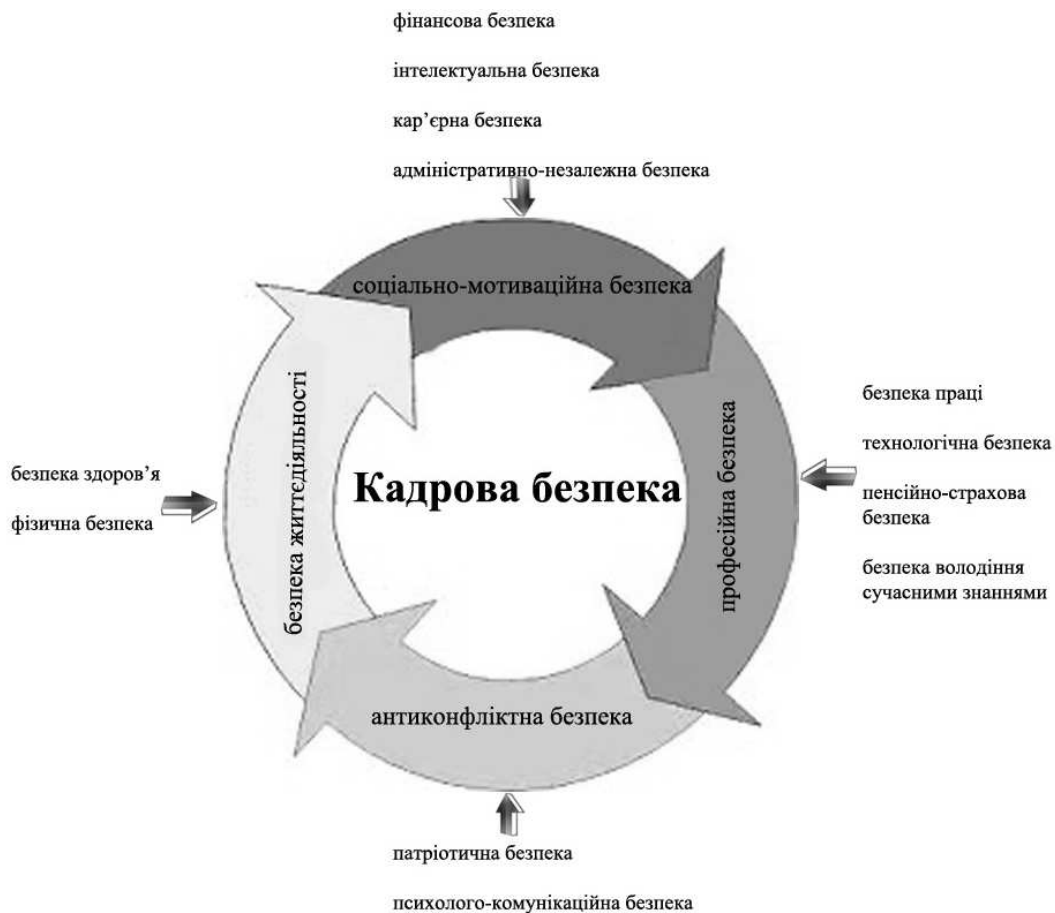
Рис. 2. Основні функціональні складові кадрової безпеки

певних структурних підрозділів; небажання та нездатність приносити максимальну користь підприємству.