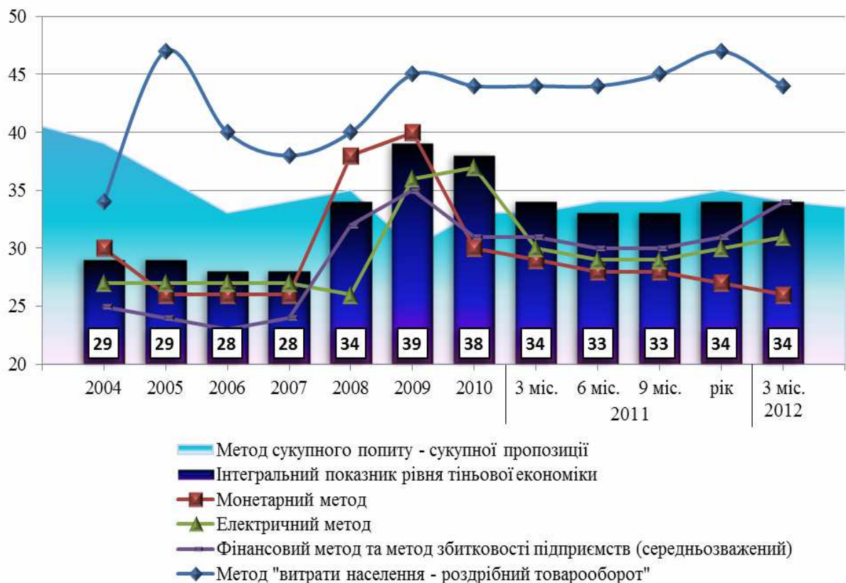
Рис. 1. Динаміка рівня тіньової економіки, розрахованого за різними методами, у відсотках від обсягу офіційного ВВП, [3].

розрахунку рівня тіньової економіки, чітко відтворюють поведінку окремих агентів у різних сферах національної економіки на різних етапах економічного циклу. За останніми розрахунками Мінекономрозвитку, у 2012 року два методи оцінювання рівня тіньової економіки з чотирьох, які використовуються на офіційному рівні, показали зростання масштабів тіньової діяльності, один – незмінність рівня тіньової економіки, і лише монетарний метод показав детінізацію економіки. Переважання сумарного приросту масштабів тінізації за окремими методами вплинуло на зростання інтегрального показника рівня тіньової економіки. Але для визначення номінального рівня використовується лише цілий показник, оскільки він є аналітично-розрахунковим, значення якого залишилося незмінним порівняно з оцінками 2011 року та I кварталу 2012 року – 34,0%.