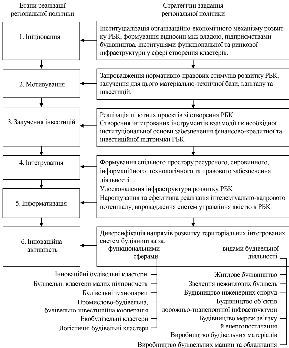
Рис.1. Послідовність реалізації стратегічних завдань регіональної політики розвитку регіональних будівельних кластерів в Україні (розроблено автором)

Як уже зазначалося, автор переконаний, що вітчизняні пілотні будівельні кластери мають створюватися, фінансуватися та всебічно підтримуватися виключно регіональними органами влади (за обумовлених механізмів та обсягів часткового фінансування з державного бюджету). Виняток можуть становити ті регіони України, де в найближчий період часу виникне достатня приватна ініціатива у цій сфері, щодо чого очікування більшою мірою песимістичні.