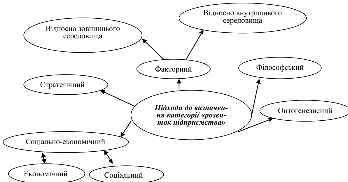
Рис.1. Підходи щодо визначення категорії «розвиток підприємства»

Структуру економічного розвитку формує розвиток усіх його елементів: розвиток економічної системи, розвиток галузі, розвиток підприємства, розвиток людського, фінансового та майнового капіталу тощо. В. Кифяк узагальнила й систематизувала підходи до трактування розвитку підприємства (рис.1) [5].